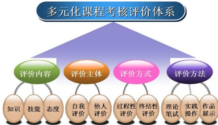
图1 多元化课程学习评价体系

监控管理制度，完善课堂教学、教学评价、实习实训、毕业设计以及专业调研、人才培养方案更新、资源建设等方面质量标准建设，通过教学实施、过程监控、质量评价和持续改进，达成人才培养规格。内容参考国家专业教学标准对专业人才培养的质量管理进行修订，并体现个性要求。具体内容描述如下。