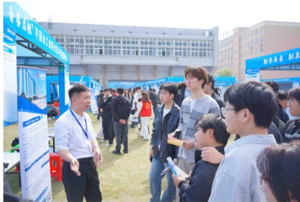
毕业生与企业沟通交流

现场人头攒动,氛围热烈,毕业生手持简历与企业就岗位要求、职业发展、薪资待遇等深入沟通,企业详细介绍发展规划与岗位需求,高效互动促成多项初步就业意向。据统计,万余名高校毕业生及社会求职者入场,累计投递简历6000余份,达成初步就业意向1106人。