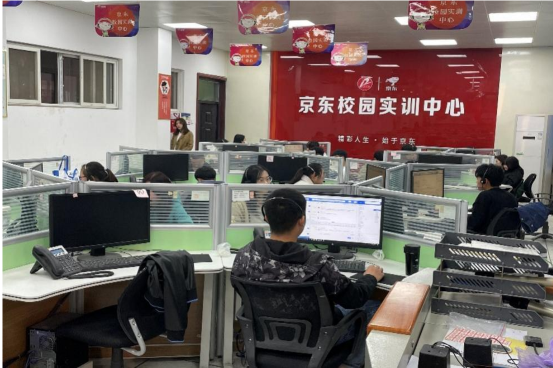
图 3-2 学生在京东实训中心参加实训

为营造舒适、和谐、整洁的“京东校园实训中心”办公环境，企业为实训中心投入以下物资：