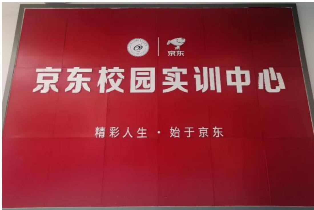
图 2-1 京东校园实训中心