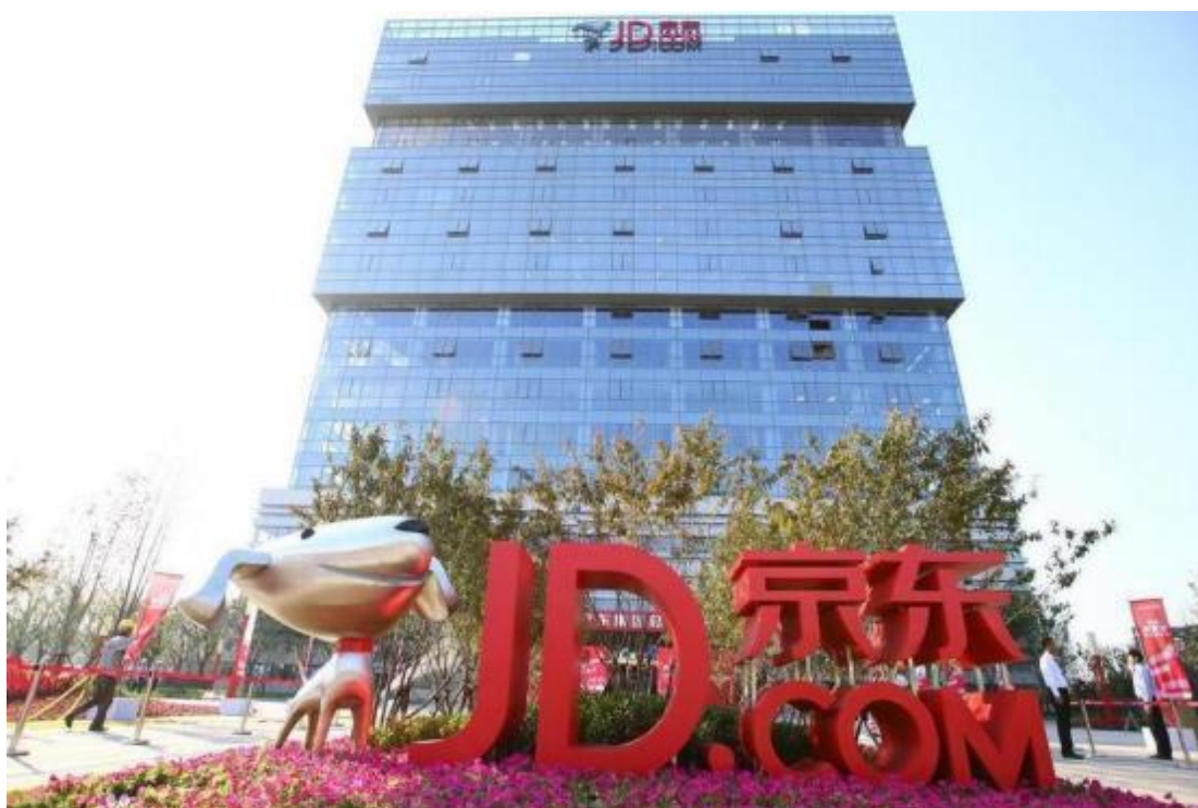
图 1-1 京东集团总部大楼

京东集团 2007 年开始自建物流，2017 年 4 月 25 日正式成立京东物流集团。京东物流是中国领先的技术驱动的供应链解决方案及物流服务商，以“技术驱动，引领全球高效流通和可持续发展”为使命，致力于成为全球最值得信赖的供应链基础设施服务商。