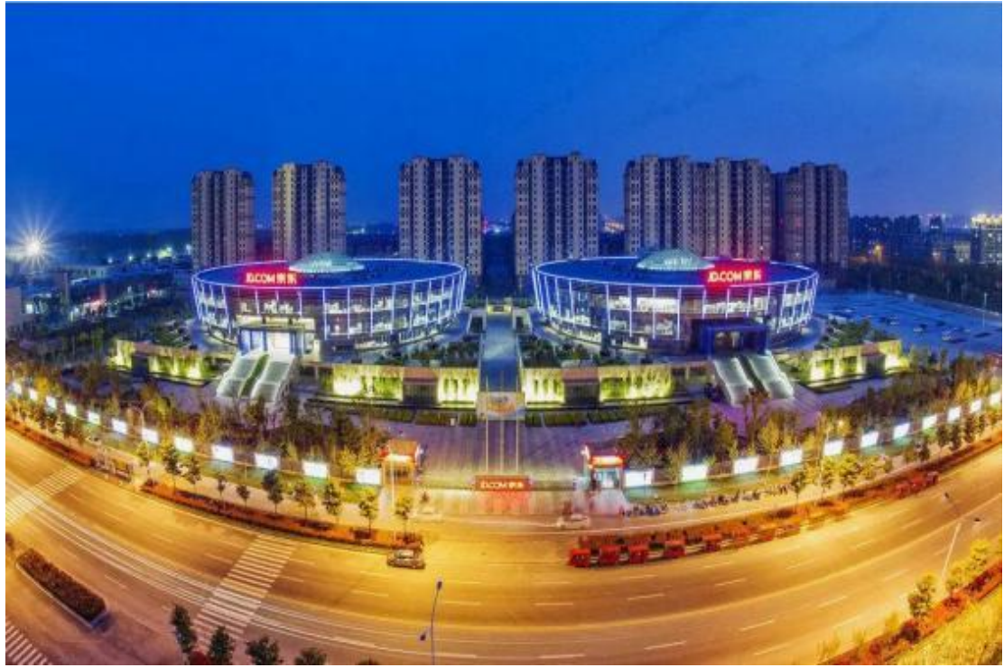
图 1-2 京东集团——宿迁全国客服中心