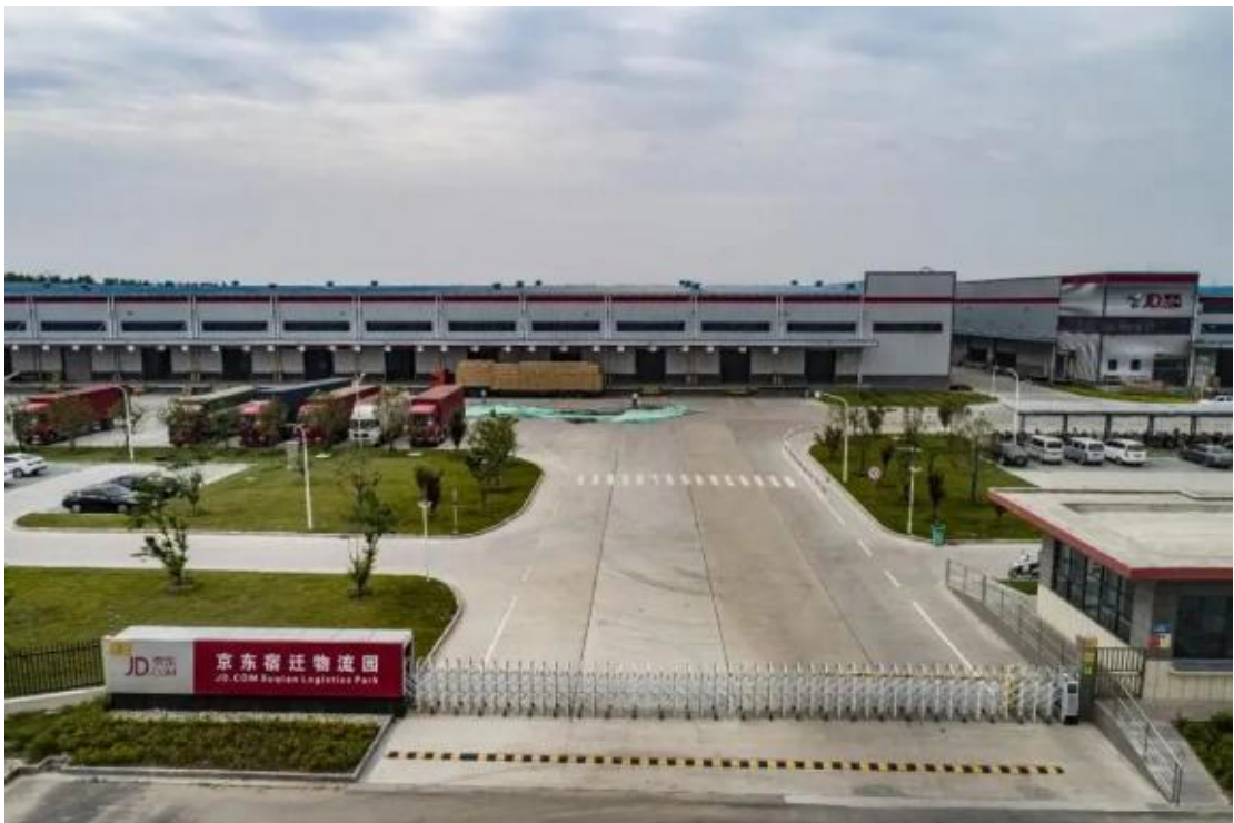
图1-3京东集团——宿迁物流园