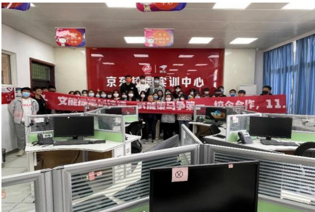
图3-1 京东校园运营中心

求和探索校企合作的全新方式，提升合作水平和成效，2018年5月与京东集团签约，合作建设“京东校园电商运营中心”。“京东校园电商运营中心”是京东全国客服中心的校园基地，该项目全方位地实现在校客服的整个流程，学生在校园中心即可处理真实的业务，学习和了解包含产品、仓储、物流、交易、结算、售后等全部电商环节的实战技术，丰富学生项目实战经验，增强学生自信心，初步打通在校生职业通道，为学生今后走上工作岗位打下了坚实的基础。