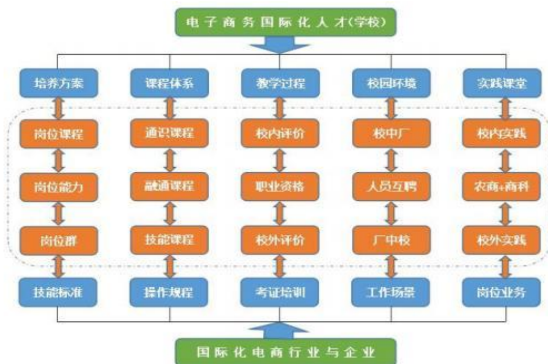
图 4-2 电子商务专业行校企“五融入”协同培养人才模式图

五是业务融入课堂，电子商务专业学生在校园企业开展业务活动，在京东集团派驻校园业务人员的示范、带领下，在企业岗位实操的过程中，完成实践教学。