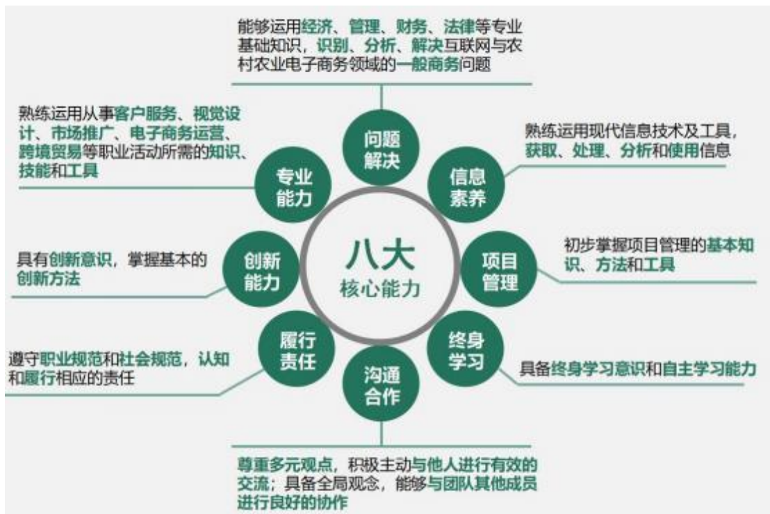
图 4-3 电子商务专业人才核心能力图