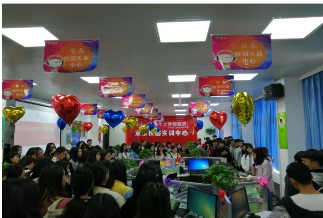
图 2-2 学生在实训中心参与企业实践